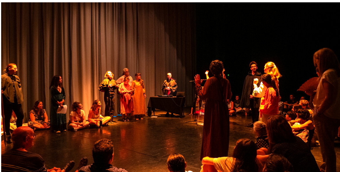
Photos issues du travail de résidence sur le territoire de Langon, juin 2023

Ainsi la Compagnie Okto mène régulièrement des actions de médiation auprès des territoires accueillant les créations avec des ateliers pratiques (avec ou sans restitution publique). Elle agit auprès d'un public intergénérationnel : retraité.e.s, collégien.ne.s, lycéen.ne.s, étudiant.e.s autour des thématiques de l'égalité Femmes/Hommes, de la déconstruction des stéréotypes, du traitement de l'information par les médias et du concept de neutralité journalistique. Elle considère ces rencontres comme particulièrement précieuses et les échanges menés nourrissent la recherche artistique de la compagnie. Lors de nos différents accueils en diffusion dans les structures culturelles, nous souhaitons toujours développer un ancrage territorial de la compagnie. Nous pensons que notre démarche artistique n'a de sens que si elle participe à tisser des liens avec les publics - empêchés ou non - entre les communautés, à consolider ainsi les relations spectateur·trice·s/artistes et à ainsi s'inscrire dans un processus de démocratisation de la culture.